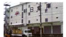
倉庫業法で定められたトランクルーム 契約・寄託契約

優良なトランクルームのための施設、業務体制を持つ倉庫業者には優良トランクルーム認定を国土交通省が与え、 認定番号の記載された 📦 マークの掲示が義務付けられます。ぜひ参考にしてください。