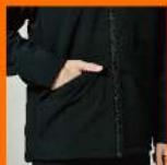
ファスナーポケット