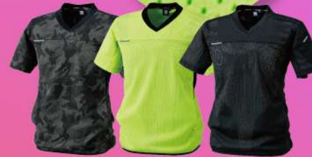
50.迷彩 80.イエロー 95.ブラック